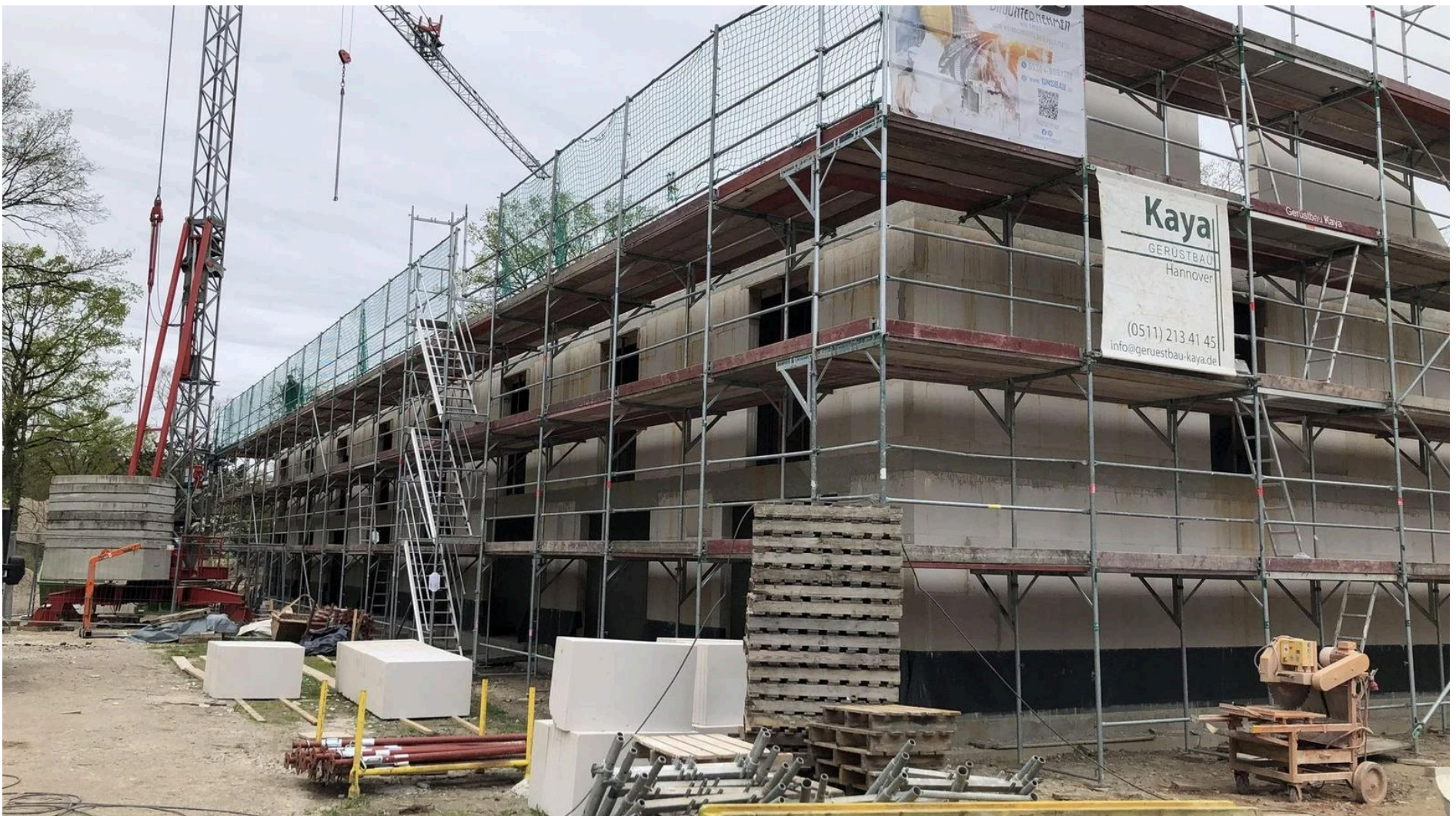
Im Baugebiet Hohe Düne in Gifhorn soll es bald weitergehen.